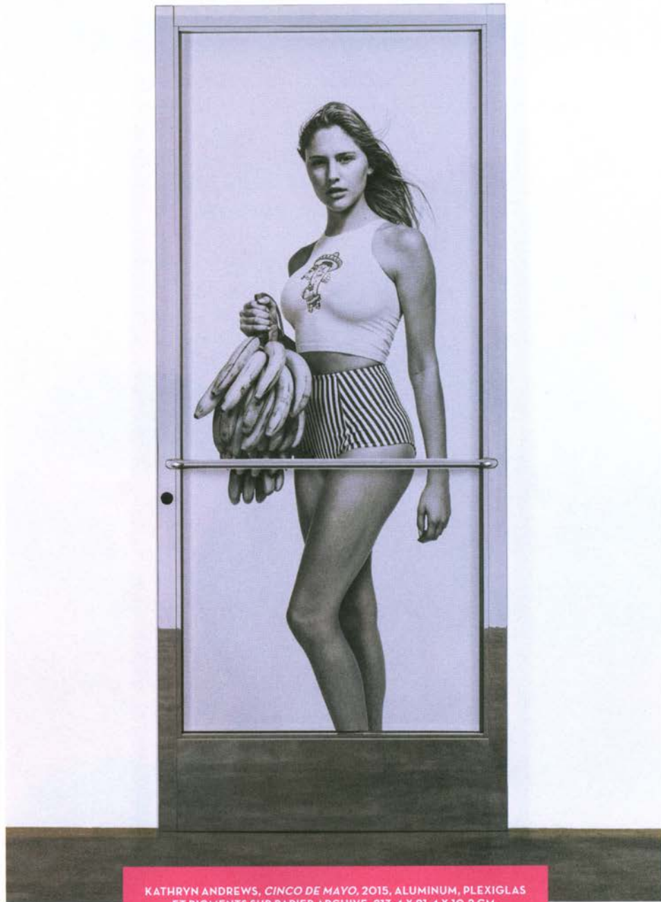
KATHRYN ANDREWS, CINCO DE MAYO , 2015, ALUMINUM, PLEXIGLAS ET PIGMENTS SUR PAPIER ARCHIVE, 213,4 X 91,4 X 10,2 CM. PAGE SUIVANTE, KATHRYN ANDREWS, HOBO (SEÑOR CORN) , 2014, ENCRE SUR PAPIER ET PLEXIGLAS, ALUMINUM.

"Pop postures: Kathryn Andrews," L'Officiel Art , No. 19, October-November 2016, pp. 98-103