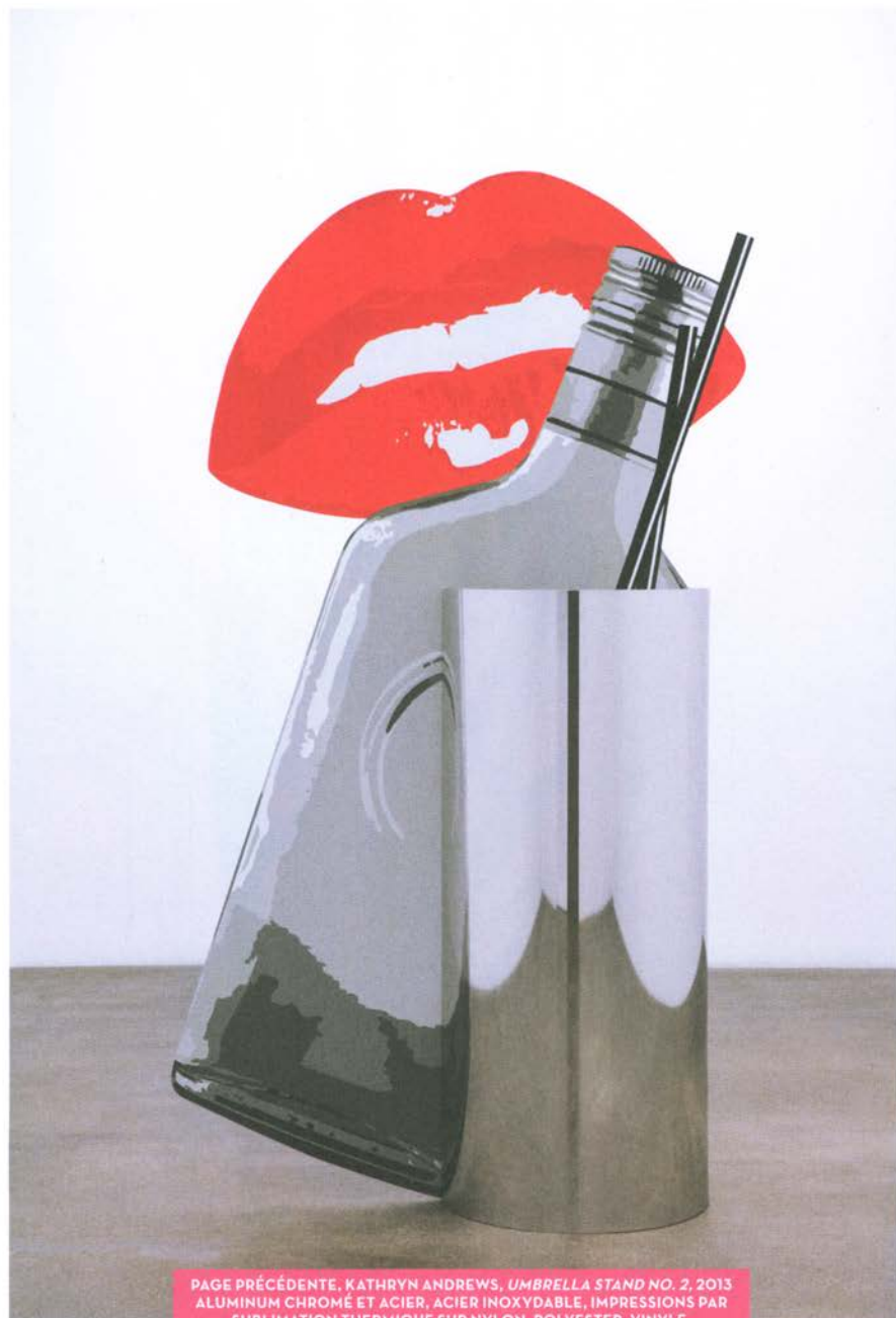
PAGE PRÉCÉDENTE, KATHRYN ANDREWS, UMBRELLA STAND NO. 2 , 2013 ALUMINUM CHROMÉ ET ACIER, ACIER INOXYDABLE, IMPRESSIONS PAR SUBLIMATION THERMIQUE SUR NYLON, POLYESTER, VINYLE, 231,1 X 88,9 X 76,2 CM. CI-DESSUS, KATHRYN ANDREWS, WHISKEY LIPS , 2016, ACIER INOXYDABLE, ENCRE, PEINTURE, 226,1 X 128,3 X 59,7 CM.

"Pop postures: Kathryn Andrews," L'Officiel Art , No. 19, October-November 2016, pp. 98-103